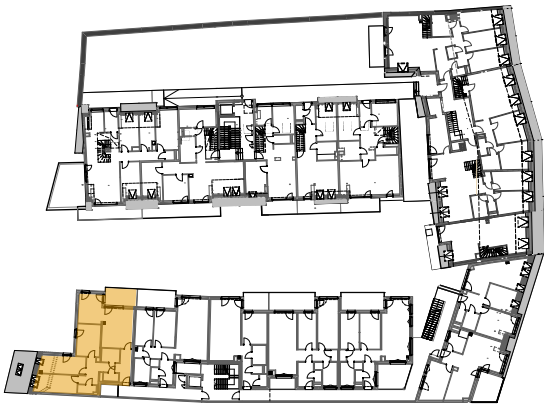
ÜBERSICHT OG 2